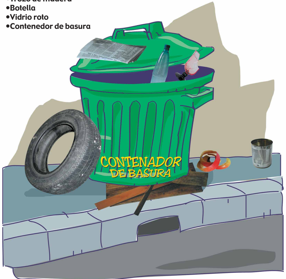
Ejemplo : "la botella está en el contenedor de basura"