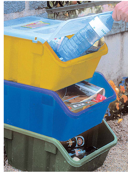
der Müll : getrennter Stoff

Du bist in Deutschland : dein Freund fragt, ob du mit ihm kommst um Abfall in Containern zu sortieren. Wie machst du es? Die folgende Übungen helfen dir dabei.